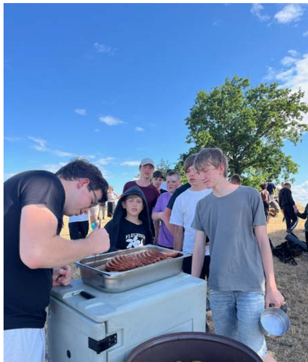
Spolek Sluníčko pořídil z dotace i kuchyňské vybavení

Nikdy tím neztratíte, vždy můžete jen získat. Ať už je to “jen” dobrý pocit, nebo dokonce životní poslání, partu přátel a krásných prožitků.