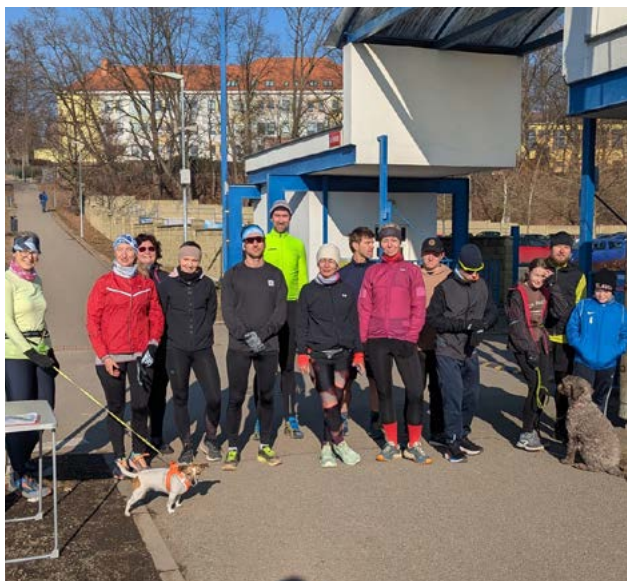
Pravidelné sobotní běhy ve Vlašimi organizují dobrovolníci koordinovaní Charitou Vlašim

a při všech dobrovolnických činnostech je přítomen pověřený pracovník Charity.