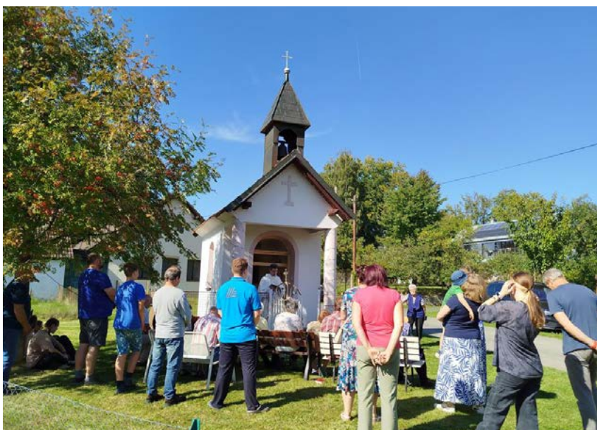
Posvícení u malebné kapličky na návsi v Děkanovicích. Obec se snaží výrazně podporovat komunitní životjak pořádáním akcí, tak nákupem vybavení.

Ze svých prostředků jsme opravili požární nádrž, rozšířili dětské hřiště o několik prvků a zrekonstruovali dva křížky.