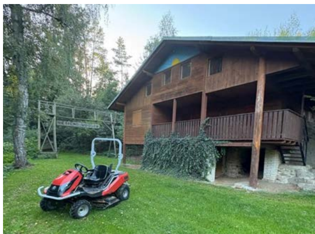
Nový traktůrek pro údržbu Měsíčního údolí

O členství jako takové je v posledních letech zvýšený zájem. Máme z toho důvodu i pořadníky. Zájem o tábory tomuto tren-