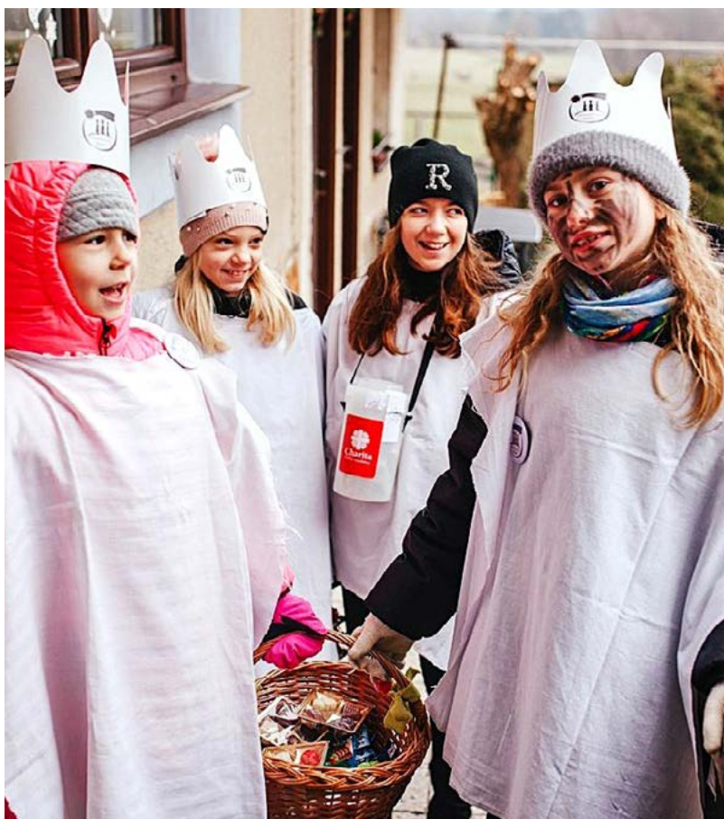
Tříkrálová sbírka patří mezi největší dobrovolnické akce Charity Vlašim

Charita dlouhodobě spolupracuje s Gymnáziem a Obchodní akademií ve Vlašimi i školami v Benešově. Studenti se při seminářích i praxích seznamují s jejími službami, a v některých případech následně zůstávají jako dobrovolníci. Roste také význam firemního dobrovolnictví – pravidelně pomáhají za-