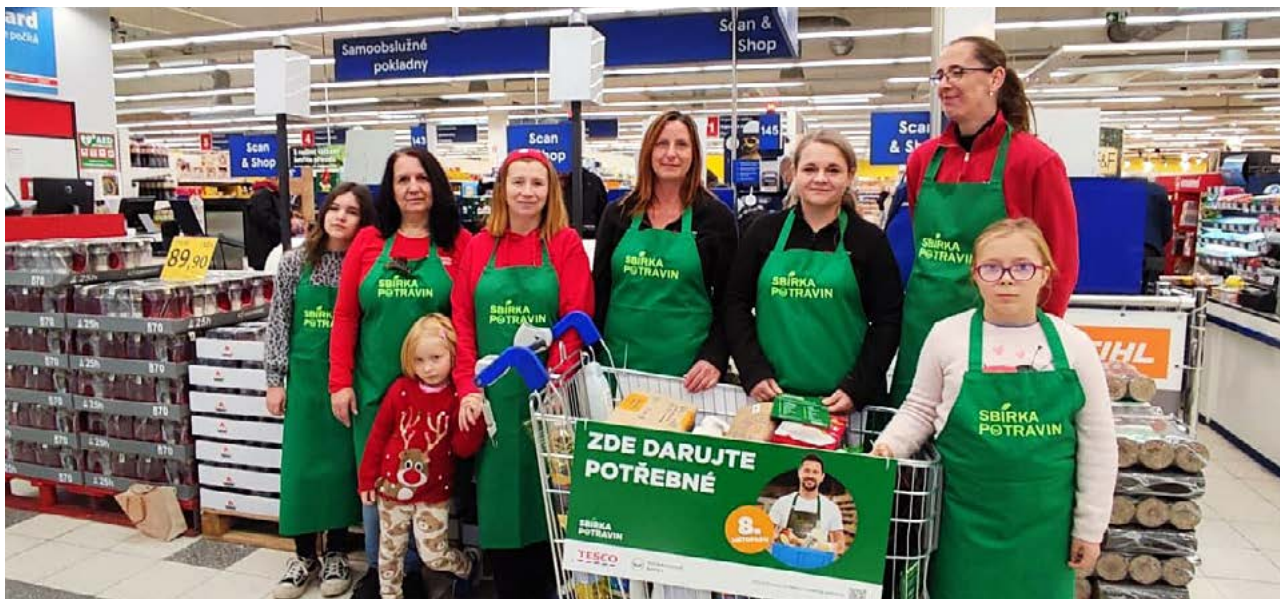
Při poslední Potravinové sbírce v Tesco ve Vlašimi se podařilo vybrat 999 kg potravin a drogerie.

U dobrovolníků docházejících do domácností probíhá alespoň jednou ročně osobní návštěva, kde se společně hodnotí vývoj situace klienta. Charita vede také průběžnou evidenci