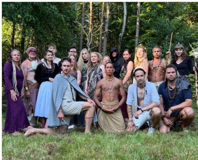
Pomáhat na dětském táboře je někdy dřina, někdy zábava