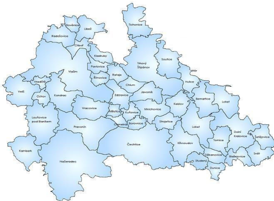
Obrázek č. 1: Mapa Území